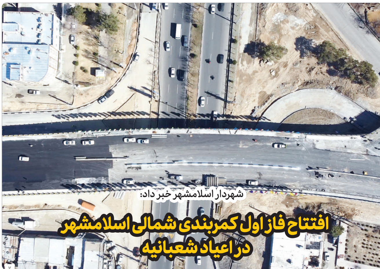
شهردار اسلامشهر خیر داد؛

افتتاح فاز اول کمربندی شمالی اسلامشهر در اعیاد شعبانیه